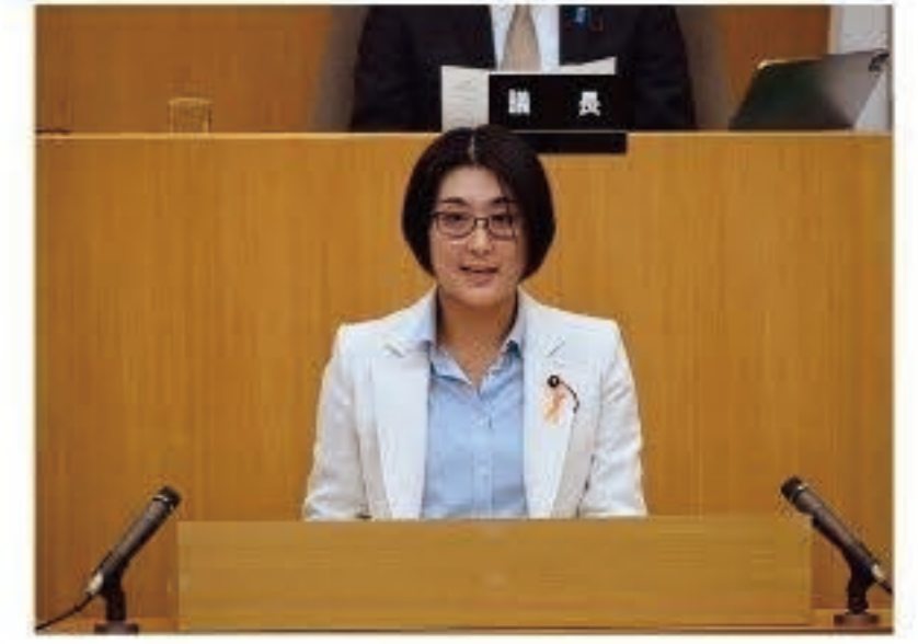
令和5年第4回定例会映像