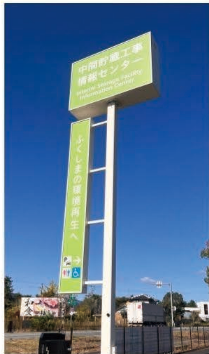
▲ 中間貯蔵施設を視察

10月に、全国災害ボランティア議員連盟の視察で、福島に行ってきました。東日本大震災から12年経った今、復興に向けて、何千人もの方々が日々尽力されている様子を見聞きすることができました。