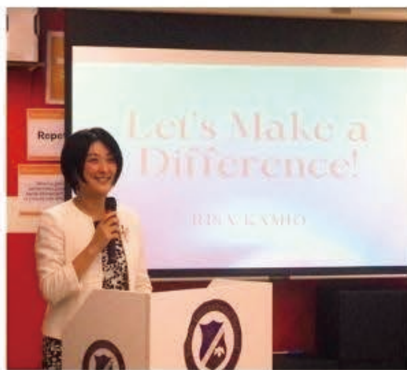
▲ ゲストスピーカーとして登壇

用賀にある清泉インターナショナルで開催された模擬国連のゲストスピーカーに招かれました。一人一人が変わることで、社会は少しずつ変わっていく、というメッセージを込めてお話させていただきました。国際社会の問題について、白熱した議論を行う若者の姿に感銘を受けました。広い視野をもつ彼らに期待しています。