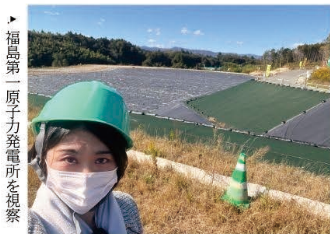
▶ 福島第一原子力発電所を視察

第一原子力発電所にも行かせていただき、津波の怖さを見せつけられました。復興のために700年ほど続いた家族の土地や畑を提供して、協力された方々がいることや、除染した土を再利用して、道路に活用する実証が行われていることなどを知りました。