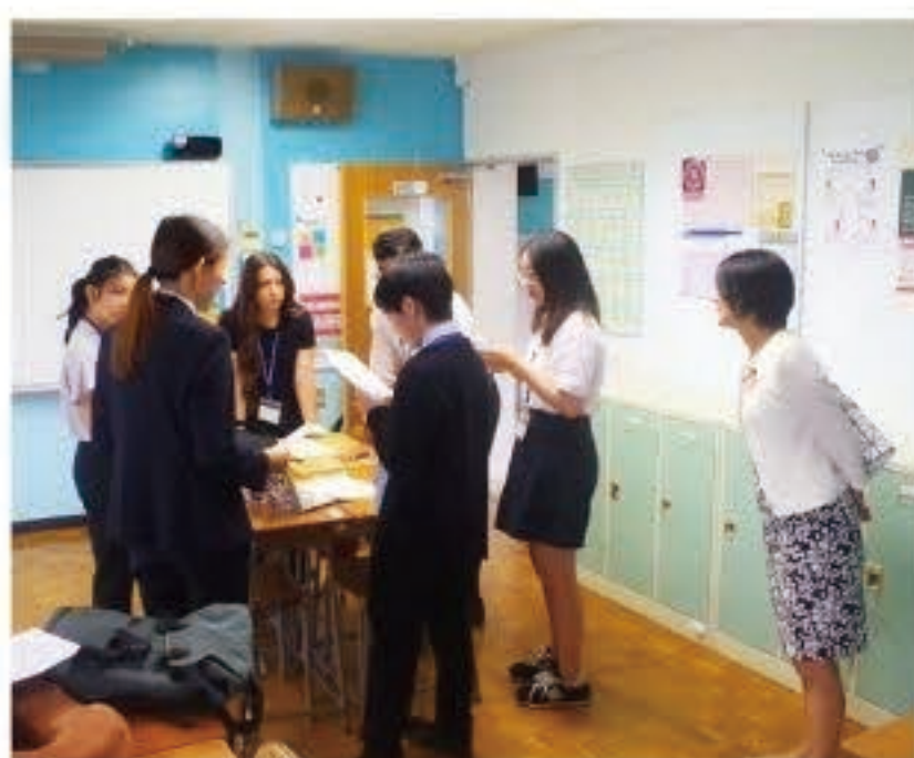
▲ 模擬国連の白熱した議論を見学