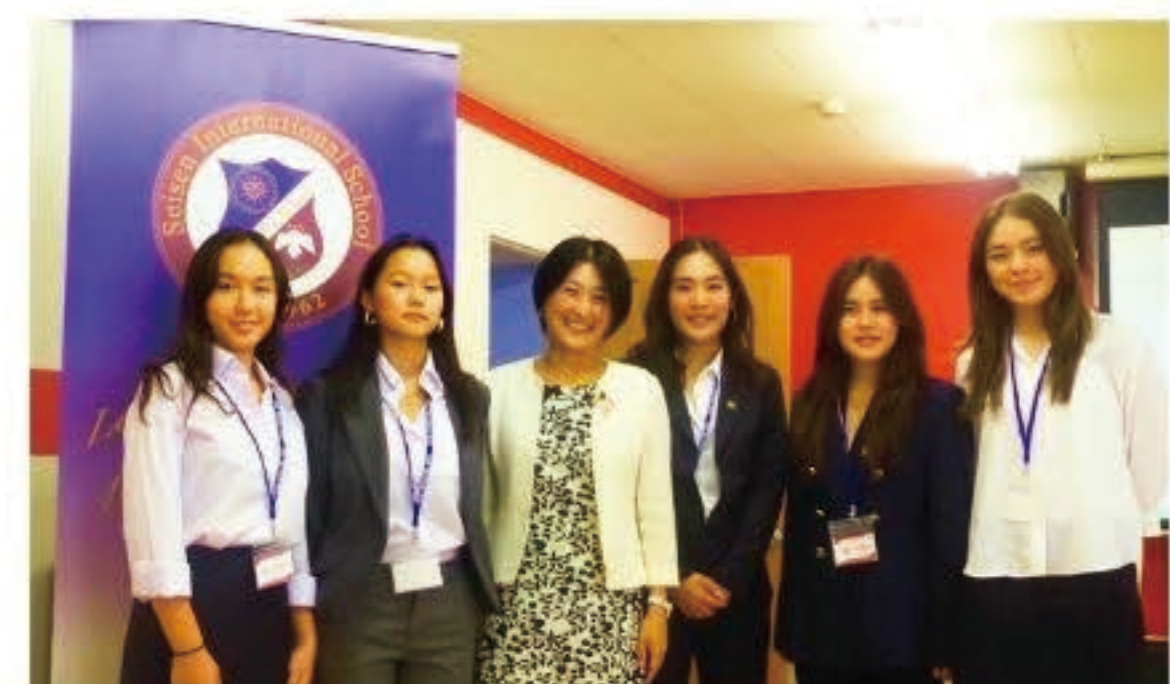
▲ 企画や準備を担当した中学生たちと