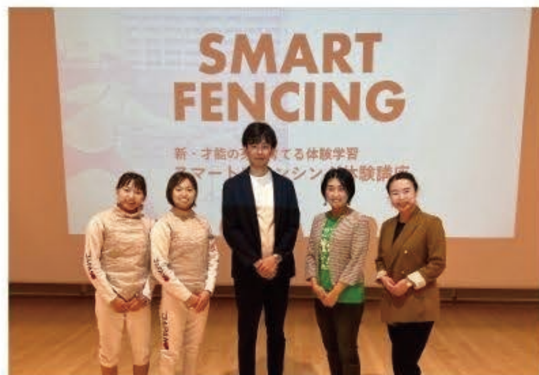
▲ 五輪代表 宇山選手(中央)・東姉妹(左)

世田谷区の小学生を対象に、東京2020大会でフェンシング金メダルを取った宇山さんが広めている、スマートフェンシングのワークショップが開催されました。柔らかい道具を使って、フェンシングの動きを習いながら、素早く動く子どもたち。皆で称えあうことや、お互いを尊重する姿勢なども学んで、目が輝いていました。お知り合いの紹介で出会った宇山さんと、世田谷区がつながったことで実現した企画。子どもたちの将来が楽しみになりました。今回、イベントを手伝ってくれた東姉妹はパリ五輪に出場予定です!ぜひ応援しましょう!