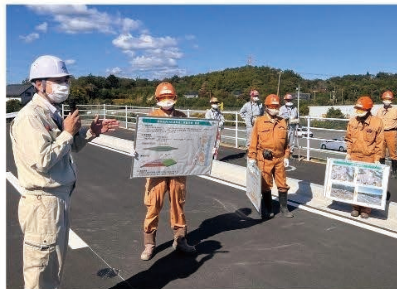
▲ 除染した土を再利用して道路を作る実証を視察

今は、長袖、長ズボンなどの通常の服装で地域内を動けるようになっていました。正確な知識を身につけて、必要以上に恐れず、正しく恐れることが必要なのだと教えられました。復興事業は、何十年もかかる長期戦です。未来の福島を作るためには、一人一人が関心を寄せて、できることで協力する必要があると思います。