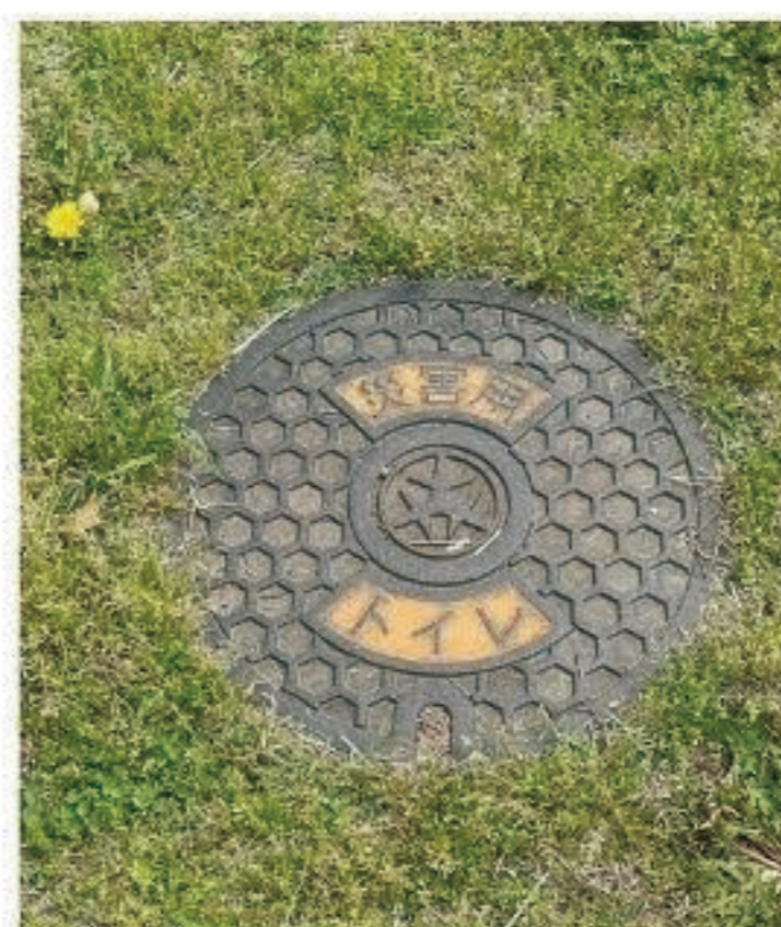
二子玉川公園 災害用マンホールトイレ